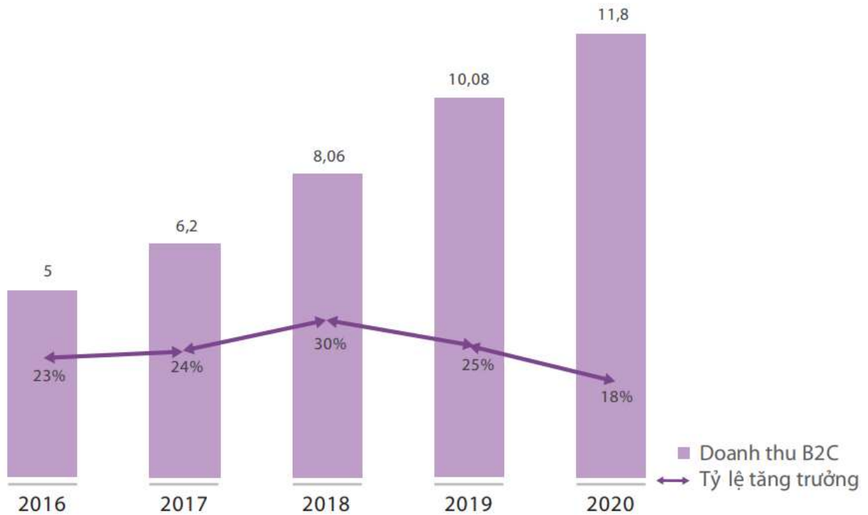
Doanh thu TMĐT B2C Việt Nam năm 2016 – 2020 (tỷ USD)

Theo Sách trắng thương mại điện tử Việt Nam 2021 của Bộ Công Thương, doanh thu thương mại điện tử; số lượng người tham gia mua sắm trực tuyến; ước tính giá trị mua sắm của một người; tỷ lệ người dân sử dụng internet và tỷ lệ người dùng tham gia mua sắm trực tuyến ngày càng tăng. Dưới đây là một số thống kê: